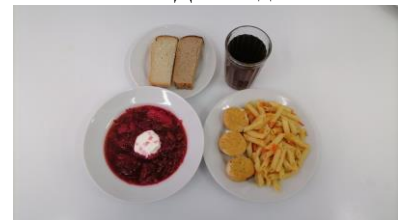
ГПД - полдник