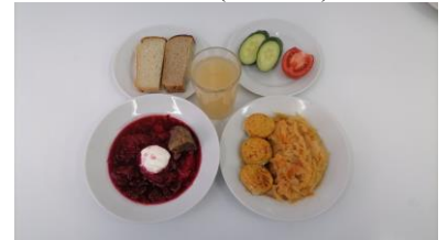
ГПД – обед