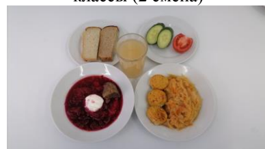
Полдник льготная категория 5-11 классы (2 смена)