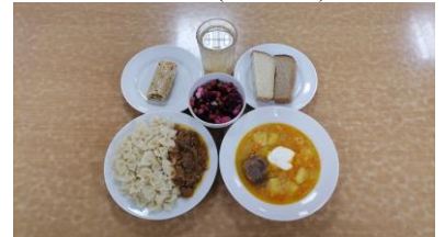
Обед льготная категория 1-4 классы (2 смена)