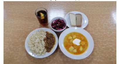
ГПД - полдник