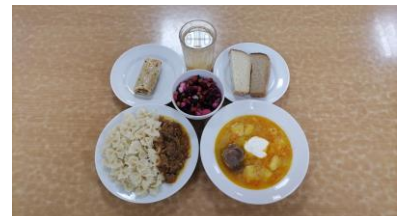
Полдник льготная категория 1-4 классы (2 смена)