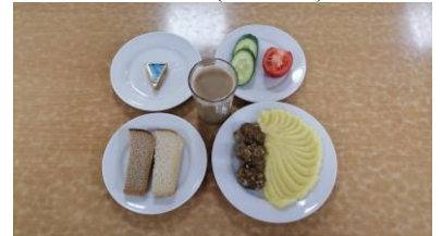
Обед льготная категория 1-4 классы (1 смена)