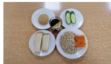
Обед платное питание 5-11 классы (2 смена)