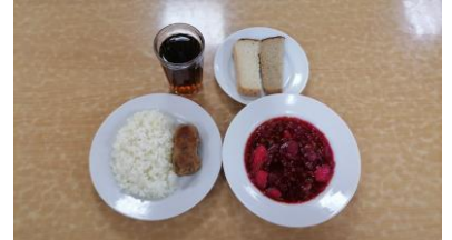
Обед льготная категория 1-4 классы (2 смена)