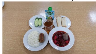
Обед льготная категория 5-11 классы (2 смена)