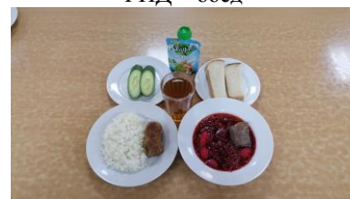
ГПД - полдник