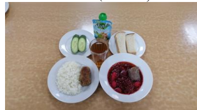
Полдник льготная категория 5-11 классы (2 смена)