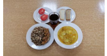
Обед льготная категория 1-4 классы (2 смена)