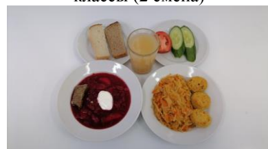
Полдник льготная категория 5-11 классы (2 смена)