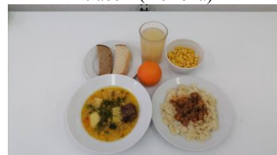
Обед льготная категория 5-11 классы (2 смена)