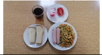
Обед платное питание 5-11 классы (2 смена)