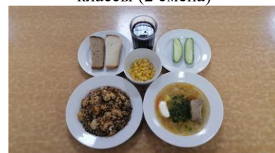
Полдник льготная категория 5-11 классы (2 смена)