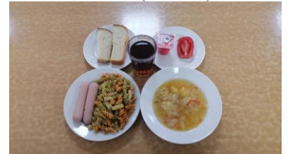
ГПД – обед