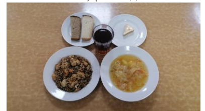
ГПД - полдник