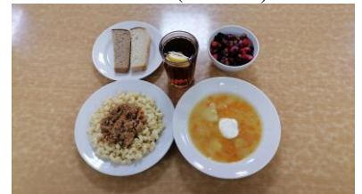
Полдник льготная категория 5-11 классы (2 смена)