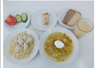
Бесплатное питание 5-11 классы