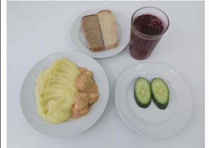
Обед льготная категория 5-11 классы (1 смена)