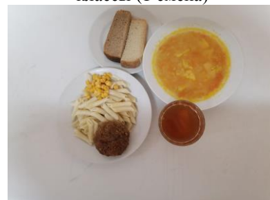
Бесплатное питание 5-11 классы