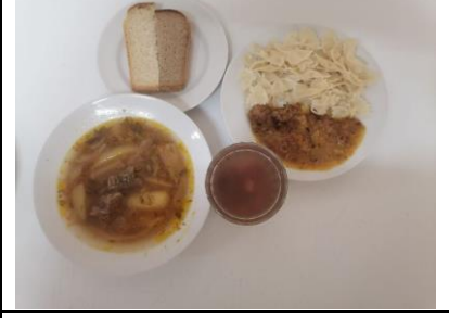
Завтрак льготная категория 5-11 классы (1,2 смена)