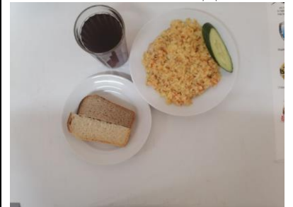
Завтрак льготная категория 1-4 классы (1,2 смена)