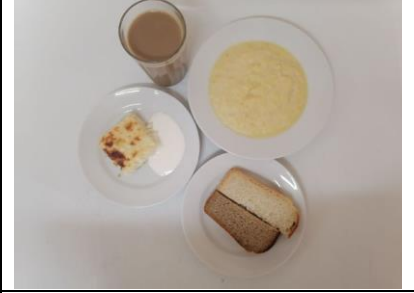
Обед льготная категория 1-4 классы (1,2 смена)