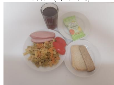
ГПД – обед