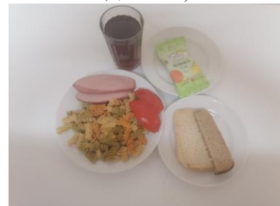
Бесплатное питание 5-11 классы