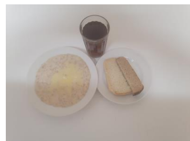
Завтрак платное питание 5-11 классы (1,2 смена)