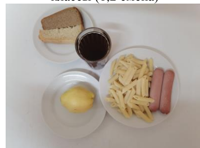
Обед льготная категория 1-4 классы (1,2 смена)