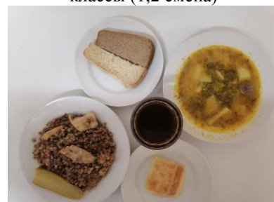
Завтрак льготная категория 5-11 классы (1,2 смена)