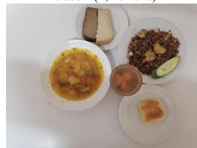
Завтрак льготная категория 5-11 классы (1,2 смена)