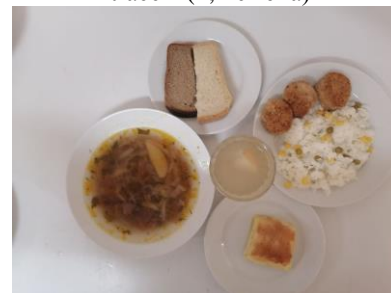
Обед льготная категория 5-11 классы (1,2 смена)