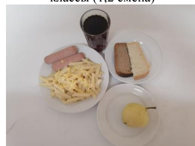
Обед льготная категория 1-4 классы (1,2 смена)