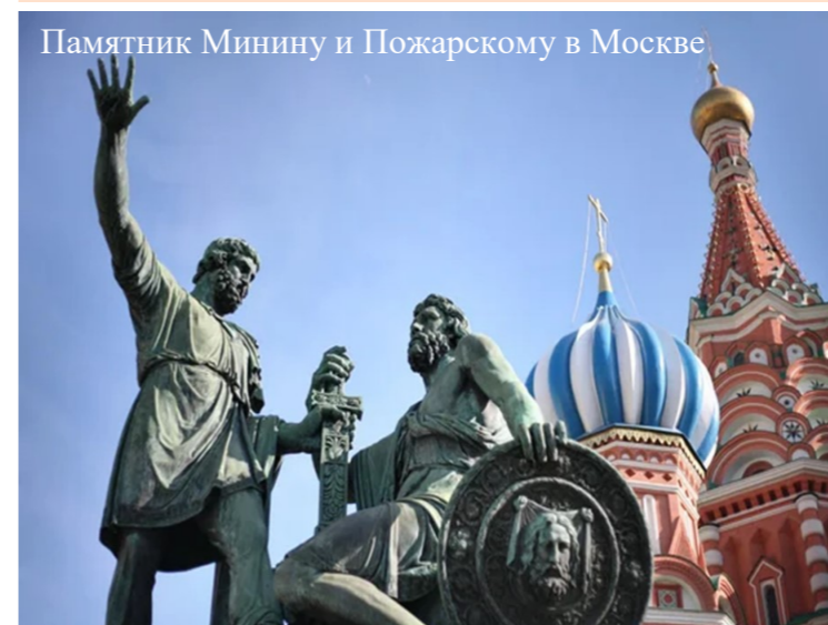
Памятник Минину и Пожарскому в Москве

Ноябрь начинается с важного для всех россиян праздника – 4 ноября страна отмечает День народного единства . Праздник был учреждён в 2005 году. Его корни уходят далеко в историю России, период Смутного времени на Руси XVII века, связан с именами князя Дмитрия Донского и воеводы Кузьмы Минина . Под их предводительством были собраны средства, создано народное ополчение и освобождена Москва от иностранных интервентов, положен конец междоусобицам и распрям. В память об освобождении, спустя два столетия, был воздвигнут знаменитый памятник Минину и Пожарскому, расположенный на Красной площади в Москве. Теперь это одна из визитных карточек столицы нашей Родины.