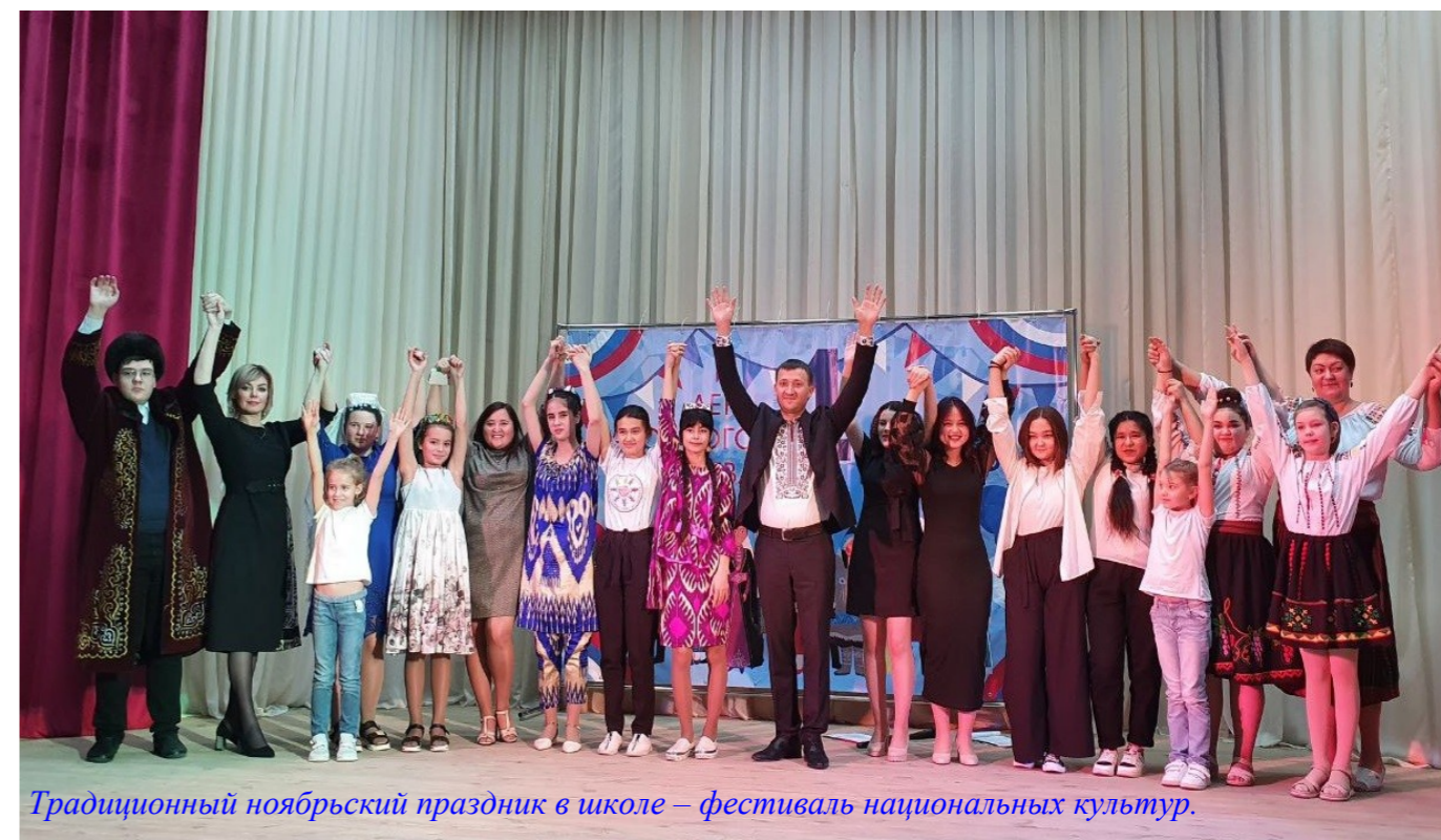
Традиционный ноябрьский праздник в школе – фестиваль национальных культур.

Учредитель: МБОУ СОШ № 22 имени Г.Ф. Пономарева Редактор: Евгения Елисеева Вёрстка: Евгения Елисеева Корректор: Мадина Халимова Педагог - Наталья Чижова