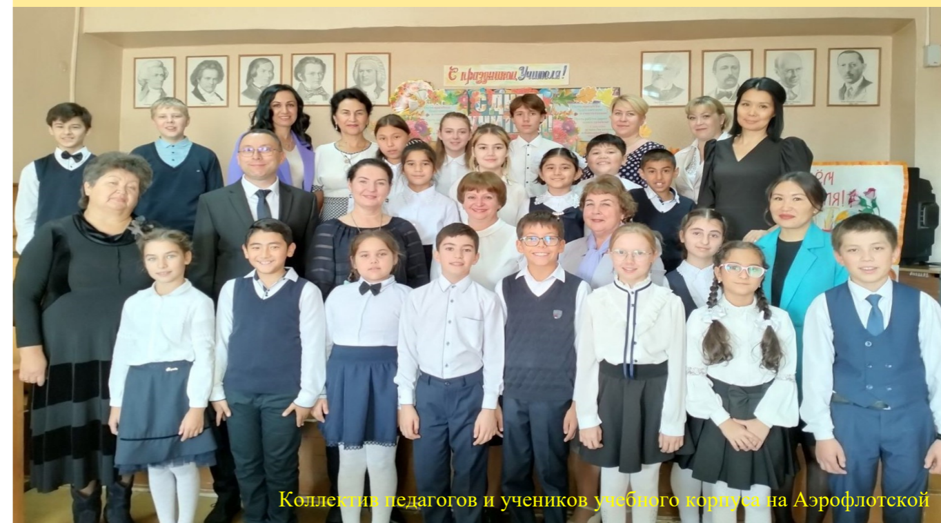
Коллектив педагогов и учеников учебного корпуса на Аэрофлотской

Редакция газеты поздравляет уважаемых педагогов школы с Днём Учителя! Примите нашу благодарность за добросовестный труд. Уверены, что школьные знания откроют все дороги в жизни, а слово «учитель» в любые времена будет звучать с уважением!