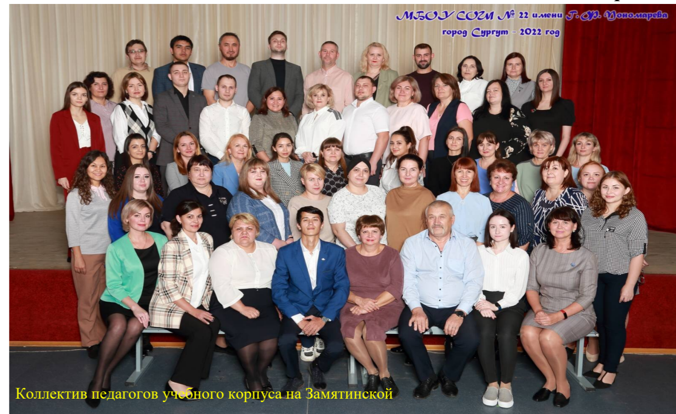
Коллектив педагогов учебного корпуса на Замятинской

Редакция газеты поздравляет уважаемых педагогов школы с Днём Учителя! Примите нашу благодарность за добросовестный труд. Уверены, что школьные знания откроют все дороги в жизни, а слово «учитель» в любые времена будет звучать с уважением!