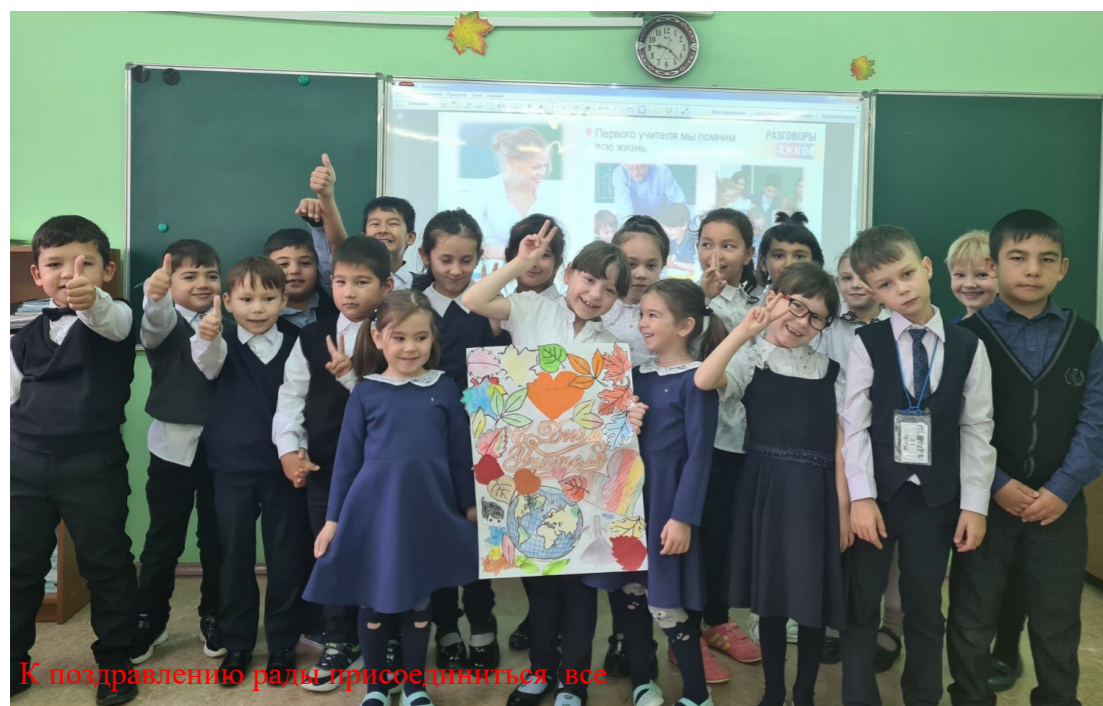
К поздравлению рады присоединиться все

Мозговой штурм, посвящённый Дню учителя, прошёл в 1 Е классе. Такой формат работы помог повысить активность всех учеников. Ребята предлагали различные варианты поздравления на день учителя. Равнодушных не было. Ученики получили возможность продемонстрировать свои идеи, научились коротко и точно выражать свои мысли.